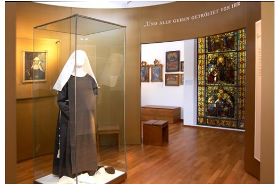
Blick in die Crescentia-Gedenkstätte

Weitere Informationen: www.crescentiakloster.de