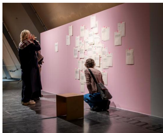
Nicola Reiter „Afdørmähdag“, Installation im Kunsthaus Kaufbeuren, 2026.

Weitere Informationen: www.kunsthhaus-kaufbeuren.de