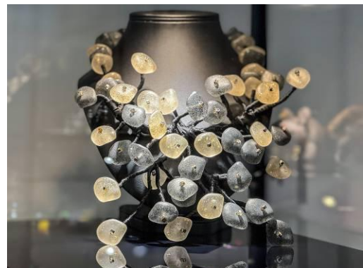
Abbildung: Erlebnisausstellung der Gablonzer Industrie

Weitere Informationen: www.erlebnisausstellung.info