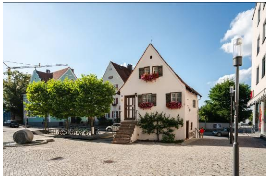
Das Zollhäuschen am Ende der Fußgängerzone in der Schmiedgasse

Weitere Informationen: www.heimatverein-kaufbeuren.com