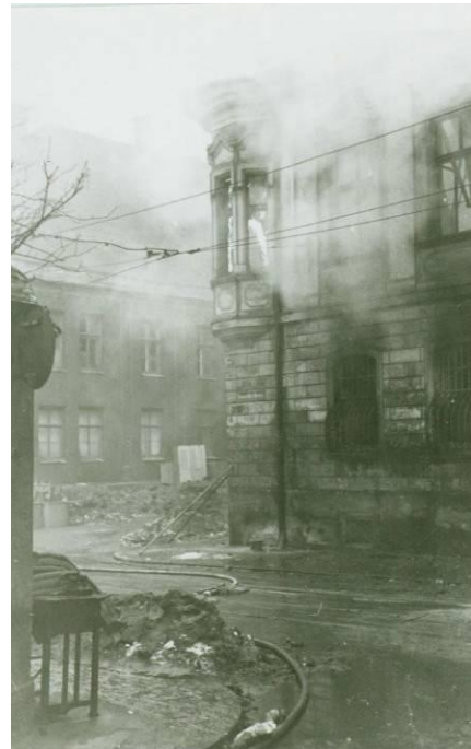
Abbildung: Brand in der Kornhausgasse Augsburg, 26.02.1944

Weitere Informationen: www.fwm-kf-oal.de