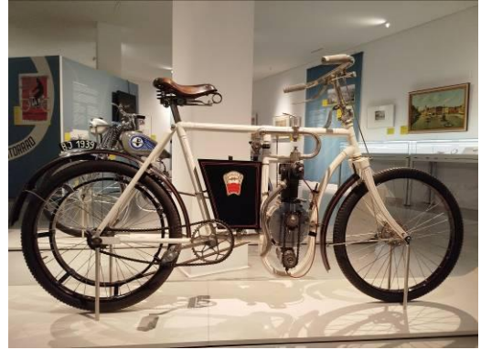
Motorrad "Slavia" von Laurin & Klement, 1905–1907, Leihgabe der Stiftung PS.Speicher.

Weitere Informationen: www.isergebirs-museum.de